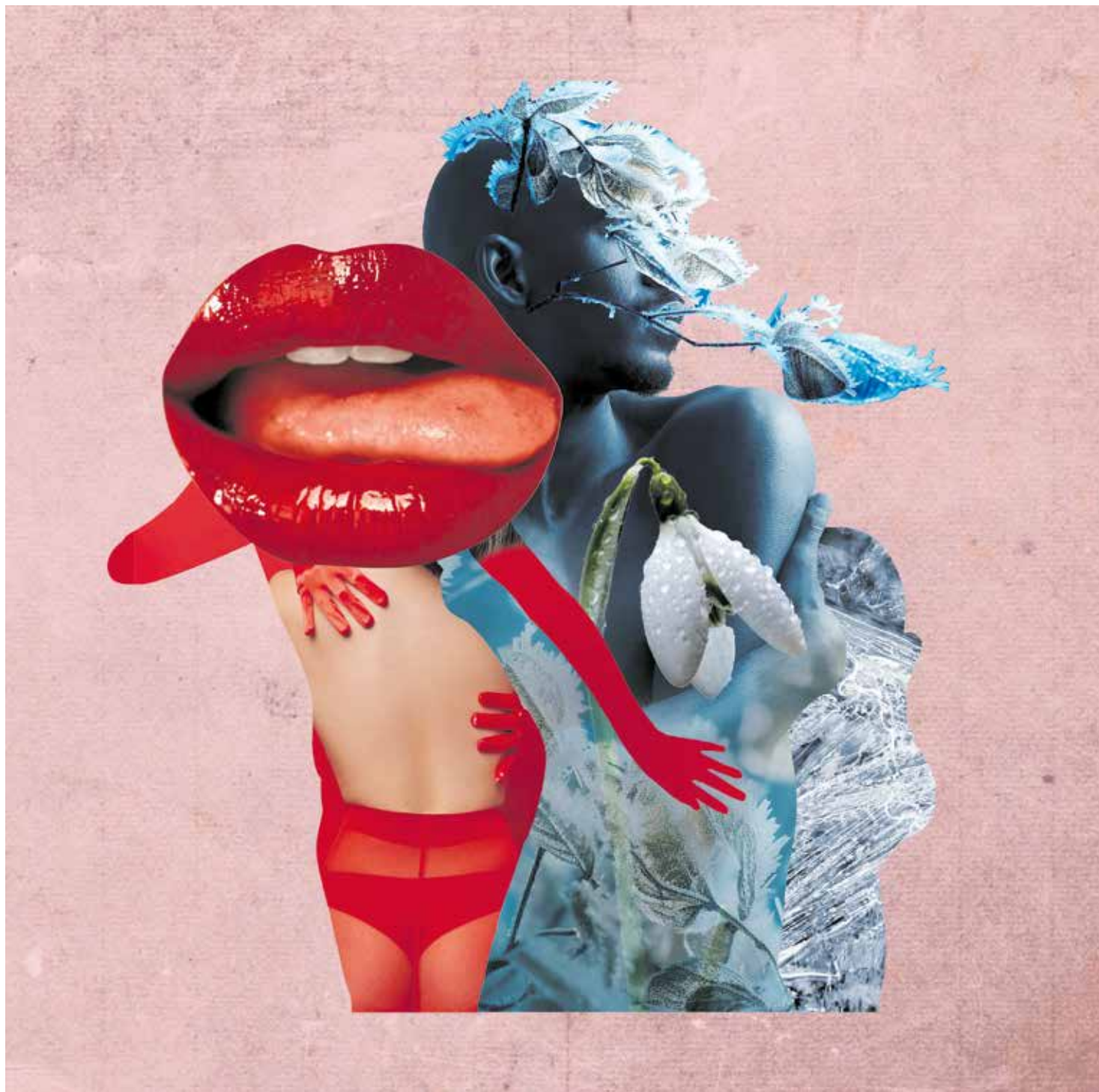
Collage: Simone Golob